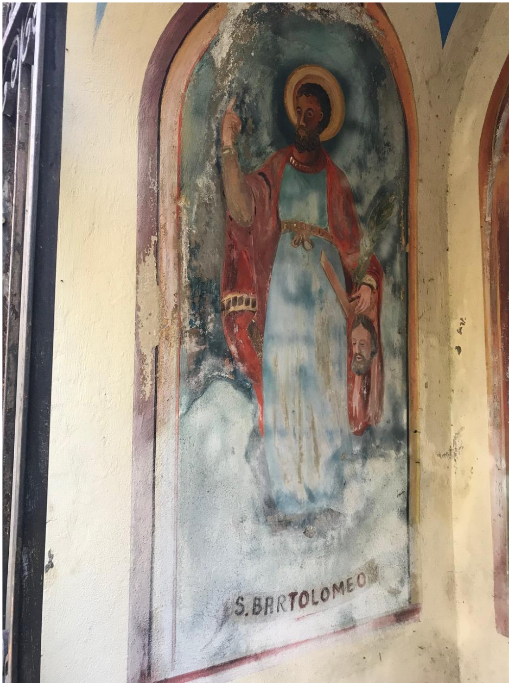
Parete di sinistra: San Bartolomeo con la palma del martirio