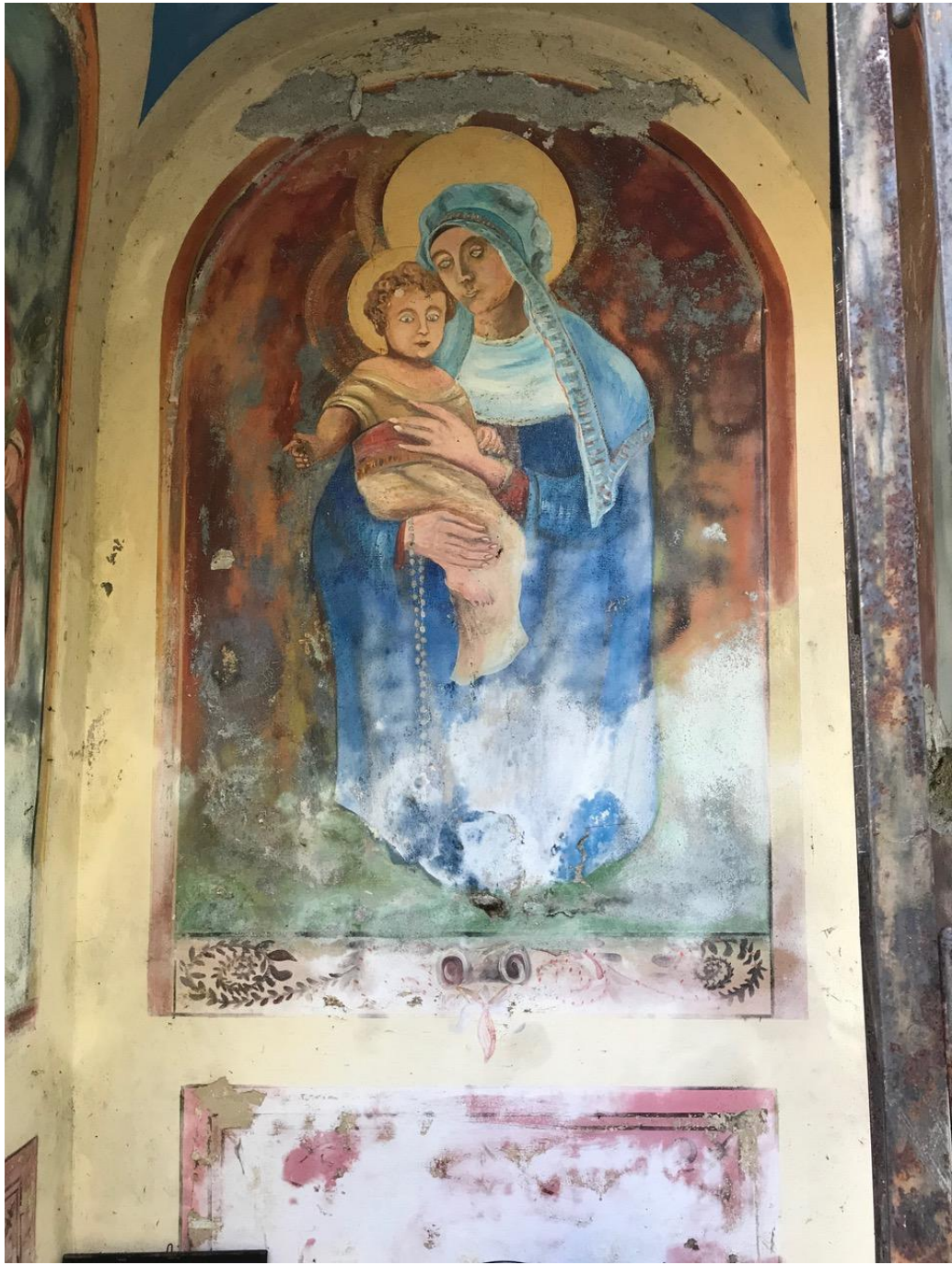
Parete di fondo: Madonna del Rosario con Bambino