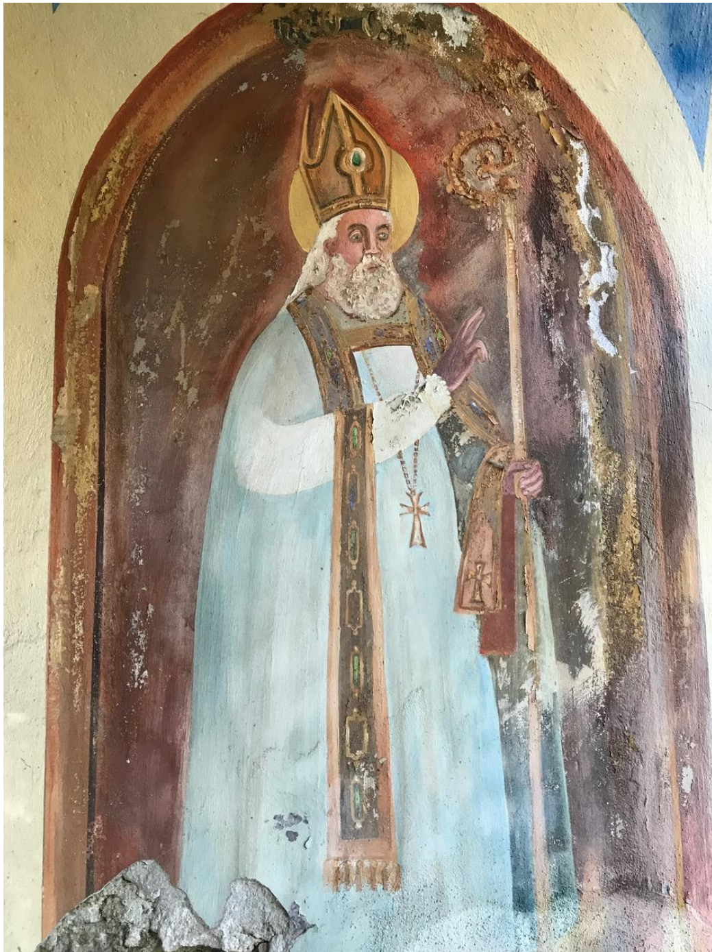
Parete di destra: San Pietro in abito bianco