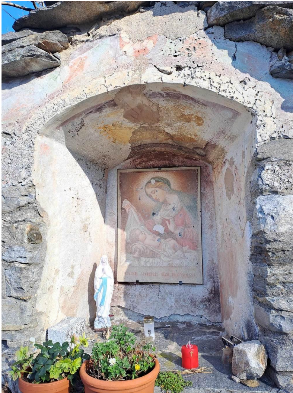
Facciata Cappella Madonna e Bambino