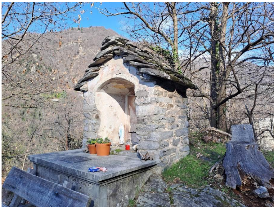
Vista generale della Cappella